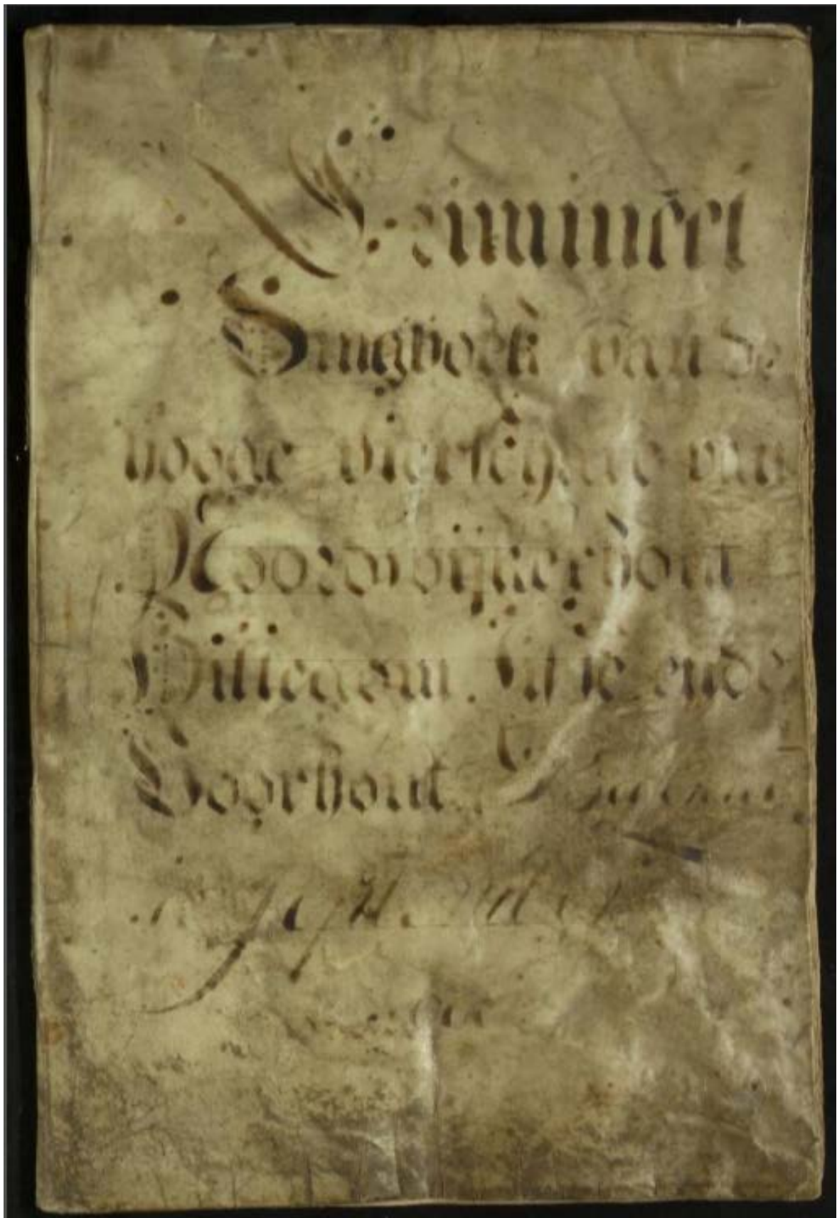
Crimineel Dingboek van Hooge Vierschaar van Noordwijkerhout Hillegom Lisse ende Voorhout 1698 – 1726 deel I en II